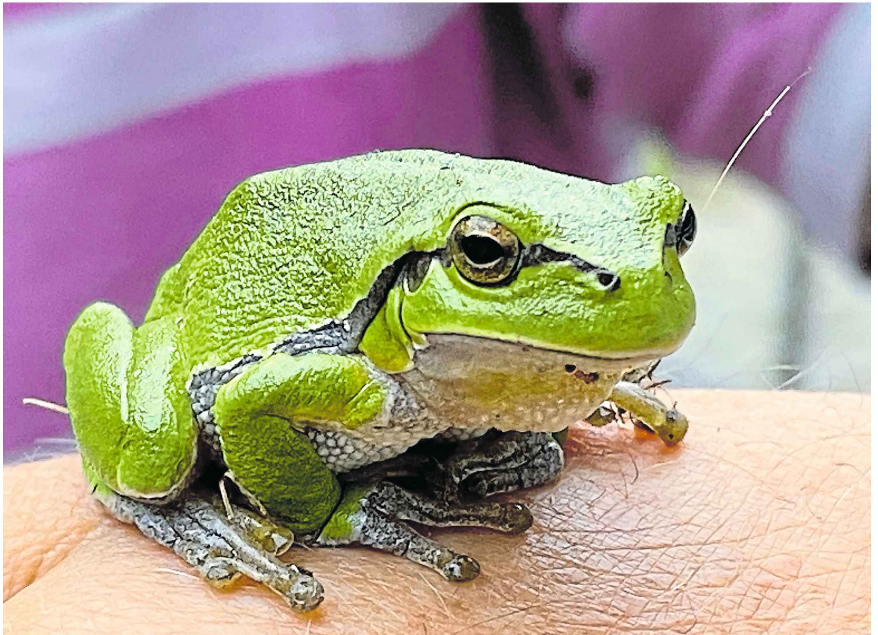
So gelassen und handzahn wie dieses Exemplar sind wohl nur sehr wenige Laubfrösche. Lieber sitzen sie auf Pflanzenstängeln und großen Blättern.

Zeugen, die Angaben zu den vier Tatverdächtigen machen können, werden gebeten, sich telefonisch unter Tel. 05221 8880 mit der Kriminalpolizei in Herford in Verbindung zu setzen.