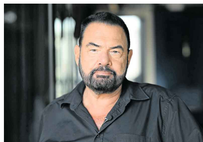
Der Sänger Marian Gold von Alphaville.

Es zeigt Animationen von ihm zu verschiedenen Zeiten, angefangen von einem Bild, das ihn im Alter von vier Jahren zeigen soll.