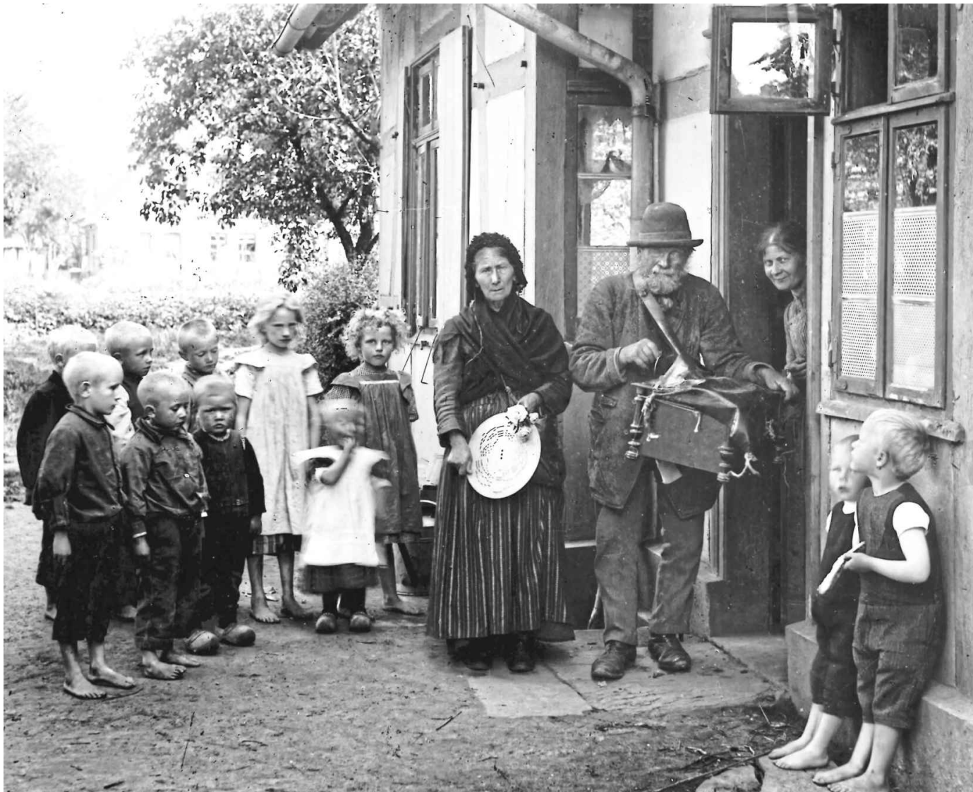
Dieses Bild machte Gottlieb Schäffer 1904. Das kleine Kind vorne rechts hat nicht ganz stillgehalten.

Seit Schäffers Schaffenszeit hat die analoge Fotografie eine rasante Entwicklung genommen. Der Zelluloidfilm löst die