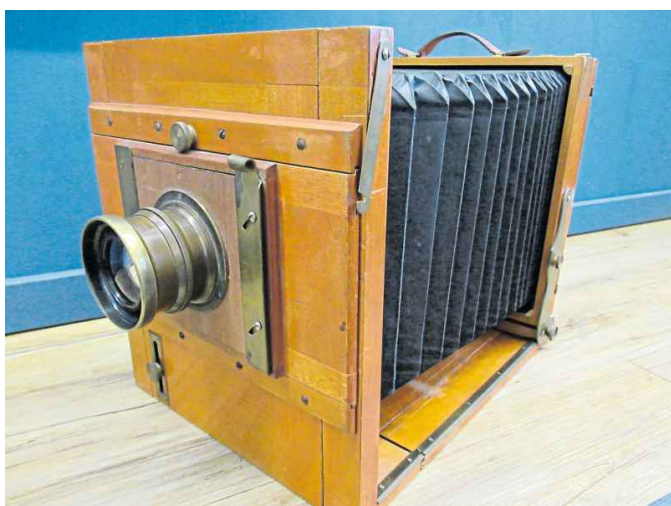
Die Reisekamera von Gottlieb Schäffer besteht zum größten Teil aus Holz.

Die beeindruckende Sonderausstellung zeigt, wie sich unser Blick auf das Handwerk verändert hat und lädt mit Vorführungen, Workshops, Märchenlesungen und Vorträgen dazu ein, sich ein eigenes Bild zu machen. Sie ist im Museum der Stadt Löhne zu sehen, jeweils samstags von 15 bis 18 Uhr sowie sonntags von 10 bis 12.30 Uhr und 15 bis 18 Uhr. Fotos aus dem Atelier Schäffer bilden einen Teil der Dauerausstellung, einige zusätzliche Aufnahmen sind bis Ende Juli in der Ausstellung „Wie die Heinzelmännchen“ zu sehen. Weitere Informationen gibt es unter www.museum-loehne.de .