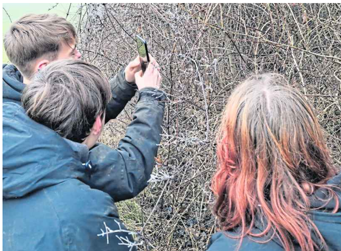
Freiwillige Helfer beim Bioblitz. Mit der App auf dem Handy können die Arten schnell bestimmt werden.

Willy Katzenstein: „Der Freiheit Wimpel weht am Mast“. Selbstzeugnisse eines westfälischen Juden zwischen Assimilation und Emigration. Eingeleitet und kommentiert von Johannes Altenberend, Veröffentlichungen der Historischen Kommission für Westfalen, Neue Folge 87, Bielefeld, 2024, 679 Seiten.