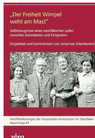
Die Biografie von Willy Katzenstein.

Ergänzt wird die Autobiografie durch Gedichte von 1939, Katzensteins Artikel in jüdischen Zeitungen, sein