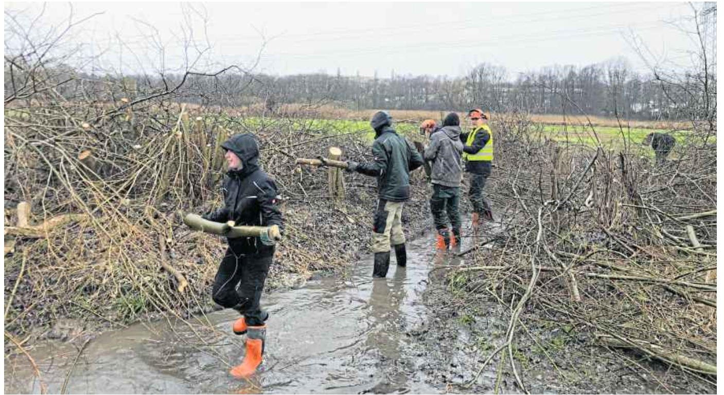
Die fleißigen Helfer tragen die letzten Brennholzstücke zusammen. Das war die letzte Aktion des Tages. Dafür haben sie sich als Menschenkette in den Lippinghauser Bach gestellt.

Ziel war es, eine Hecke und angrenzende Gehölze zurückzuschneiden. Als Offenland-Gebiet ist das Füllenbruch ein wichtiger Lebensraum für Kiebitze und Rohrweihen. Zur Besucherlenkung und als Betretungsschutz haben die Gemeinde Hiddenhausen, der Kreis Herford, die SPD Hiddenhausen und die Biologische Station Ravensberg vor über 15 Jahren diese Hecke aus Weißdorn und Weiden entlang der Stöckerwiese in Sundern gepflanzt. Für die SPD war es jetzt „selbstverständlich, bei dieser Aktion zu unterstützen“, wie sie in einer Mitteilung schreibt, es sei ja schließlich ihr „Kind“.